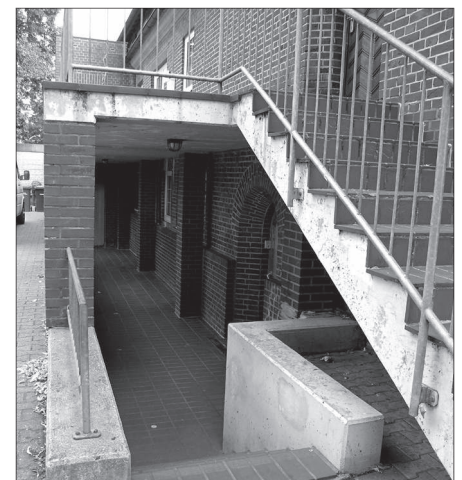
Das alte Jugendheim in St. Dionysius Nordwalde: Eingang zur KOT.

Der dringende Sanierungsbedarf des alten, zu großen Pfarr- und Jugendheim