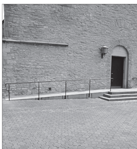
Rampe am Eingang der St.-Agatha-Kirche in Everswinkel-Alverskirchen.

mes veranlasste die Kirchengemeinde, über einen bedarfsgerechten Neubau nachzudenken. Zur Optimierung und Zentralisierung der kirchlichen Aktivitäten wurde der Gedanke aufgegriffen, das Pfarrheim in die Seitenschiffe der Pfarrkirche zu integrieren. Um ein funktionales und nutzungsoptimiertes Gebäude zu erhalten, sollte auch die barrierefreie Nutzung bedacht werden. Beim Umbau der Pfarrkirche in Nordwalde wurden neben der Kirche auch das in das Kirchengebäude integrierte Pfarrheim durch eine bodengleiche Tür und das Medienzentrum (Bücherei) durch eine einfache Rampe behindertengerecht erschlossen. Zur barrierefreien Nutzung der Obergeschosse entstand in Pfarrheim und Bücherei je ein behindertengerechter Aufzug.