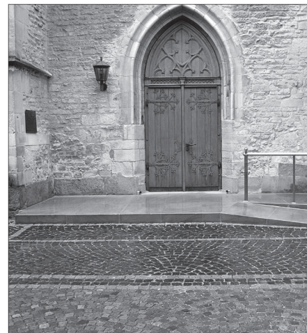
Seiteneingang der Pfarrkirche St. Gertrudis Horstmar.