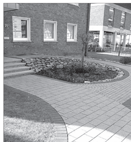
Rampe vor dem Pfarrhaus von St. Stephanus in Beckum.