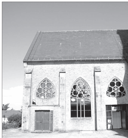
Das neue Pfarrheim liegt ebenerdig im Seitenschiff von St. Dionysius Nordwalde.

mes veranlasste die Kirchengemeinde, über einen bedarfsgerechten Neubau nachzudenken. Zur Optimierung und Zentralisierung der kirchlichen Aktivitäten wurde der Gedanke aufgegriffen, das Pfarrheim in die Seitenschiffe der Pfarrkirche zu integrieren. Um ein funktionales und nutzungsoptimiertes Gebäude zu erhalten, sollte auch die barrierefreie Nutzung bedacht werden. Beim Umbau der Pfarrkirche in Nordwalde wurden neben der Kirche auch das in das Kirchengebäude integrierte Pfarrheim durch eine bodengleiche Tür und das Medienzentrum (Bücherei) durch eine einfache Rampe behindertengerecht erschlossen. Zur barrierefreien Nutzung der Obergeschosse entstand in Pfarrheim und Bücherei je ein behindertengerechter Aufzug.